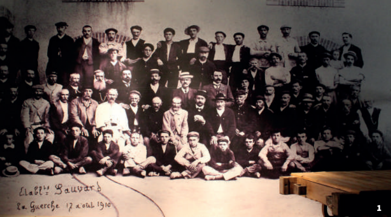
Maquette F. Taillard, M. Berbain (PLVA) d'après DES SIGNES studio Muchir Descloids 2018