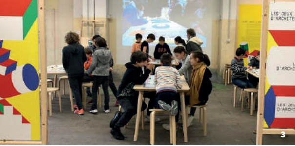
3. Exposition « La ville en jeux », Cie des rêves urbains